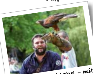
Zauberwaldspektakel - mit Live-Musik und Feuershow