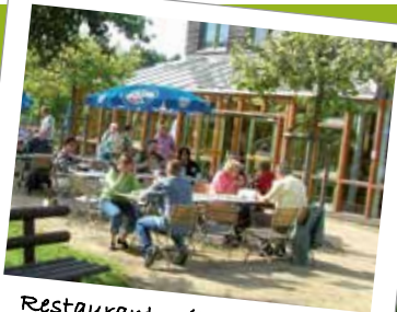
Restaurant mit Seeterrasse