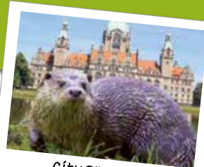
CityOTTER - Wildtiere in der Stadt