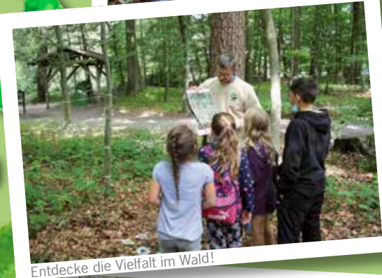
Entdecke die Vielfalt im Wald!