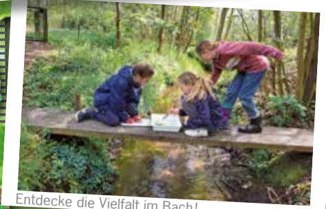
Entdecke die Vielfalt im Bach!